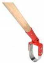
Sarcoir oscillant OMEGA

La gamme d'outils manuels permet à tous utilisateurs d'apporter dans son quotidien un instrument performant, ergonomique et maniable. Les travaux répétitifs étant bien souvent fatigants, il est nécessaire d'utiliser des accessoires de bonne qualité. Nous accordons une grande importance à la solidité et à la finition de nos outils.