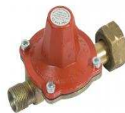
Détendeur haute pression pour gaz propane. 2.5 bars - 6 kg/ h. Référence : 760002