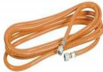
Tuyau flexible d'alimentation de gaz pour désherbeur thermique. Équipé de raccords 4x11 DK6 à écrous mobiles montés. Longueur 5m. Référence : 760001