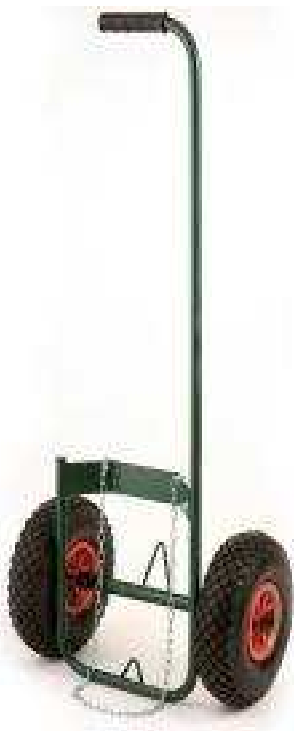
Chariot avec roues gonflables Ø 260 spécialement étudié pour bouteilles de gaz. Référence : 760000