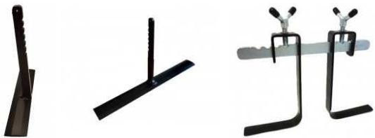
Lames de 250 ou 450 mm