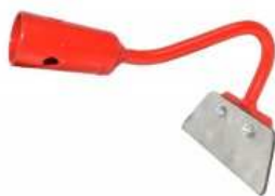
Binette à lame interchangeable