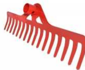
Râteau acier 300mm et 400mm