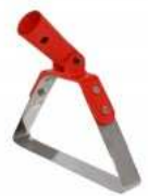
Sarcoir oscillant DELTA